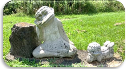
カッパ伝説の里 北波多

「自他を大切にし 互いに認め合い 共に高め合う生徒の育成」 ～ チャレンジと思いやり ～